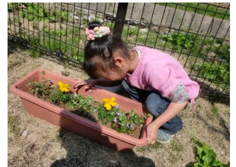
黄色の花、きれいだね～！