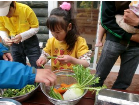
この野菜なーにー？