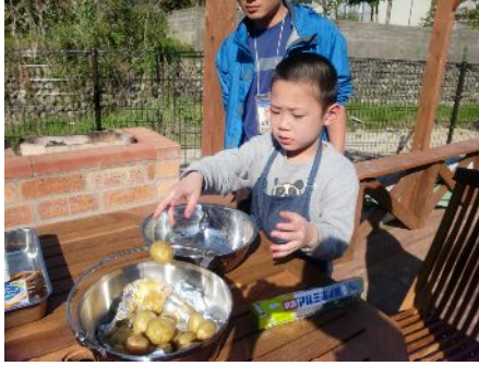
洗ったじゃがいもをポーン