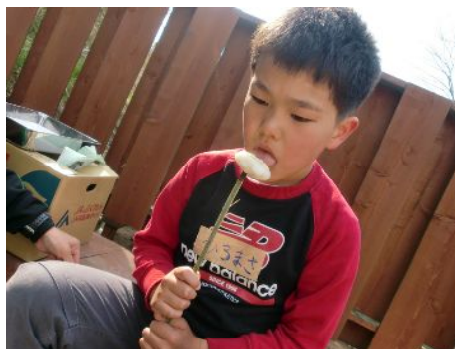
ちょっとあちち・・・