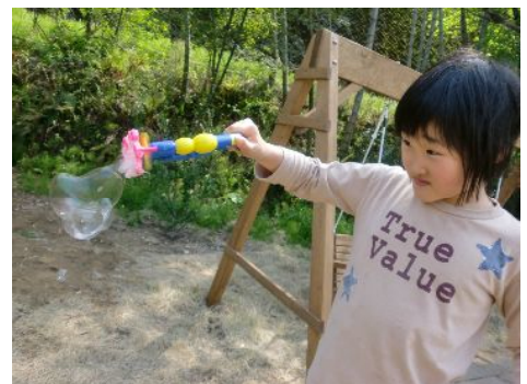
おもしろい形ができたなー。