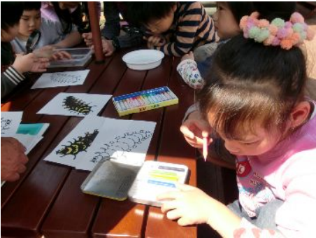
どの色がいいかなー？