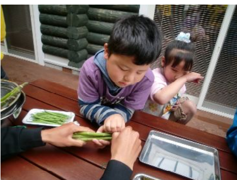
これがアスパラ・・・