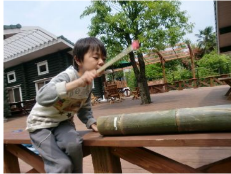
ポーンポーン いい音！