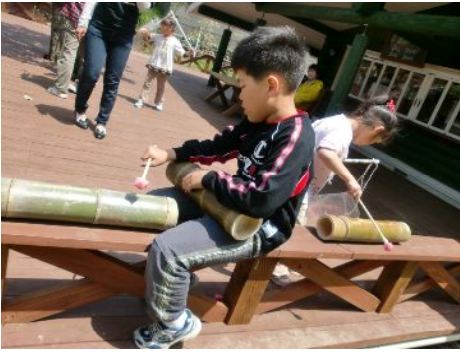
竹の楽器なんてあるんや・・・