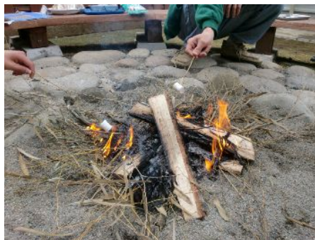
マシュマロを焼いています！