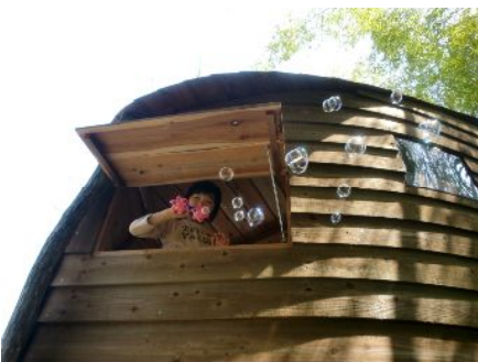
ツリーハウスからも・・・！