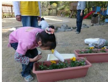
わぁ～なんて花かなー。