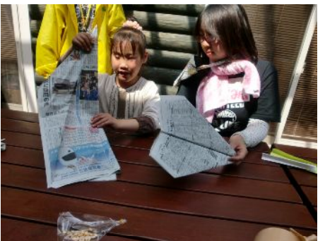
紙飛行機つくるー？