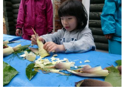
皮むきに夢中・・・