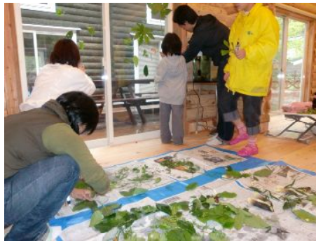
窓に葉っぱをペタペタ・・・