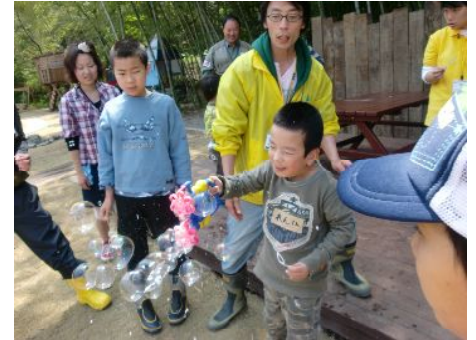
みんなですると楽しいね～。