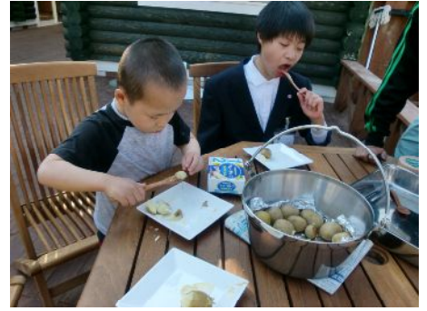
マーガリンに付けて食べるぞ～