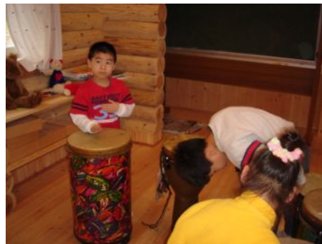
これ何の音・・・？