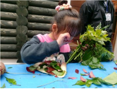
いろんな葉っぱがあるんだね～。