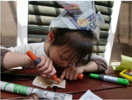
ガムテープにも色塗り・・・