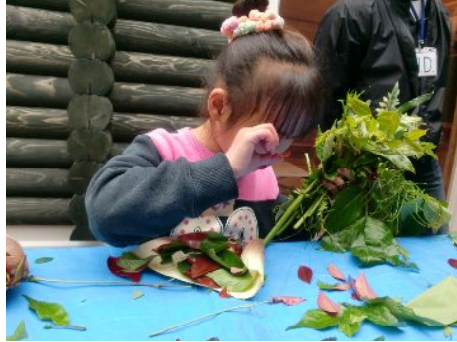
この葉っぱは赤色～？