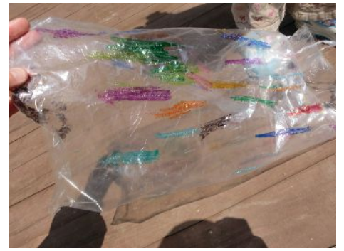
こいのぼりに色をぬりましたー！