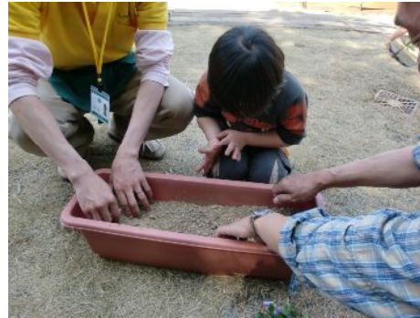
よしっ僕も土いれるぞー！