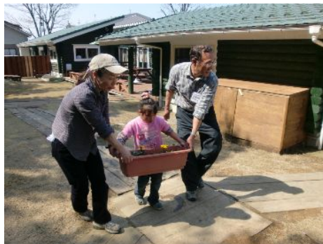
どこに置くのがいいかな～？