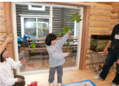
こんな長いのもあるー！