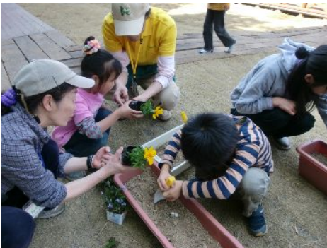
一生懸命スコップを使っています！