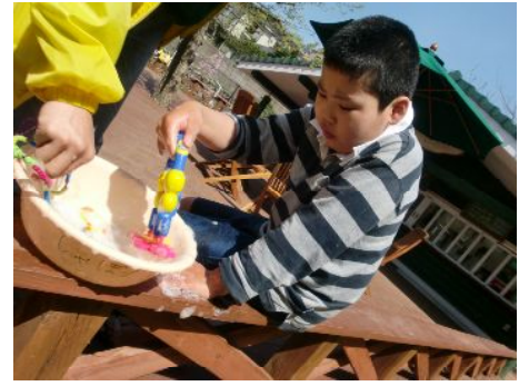
たっぷりしゃぼん玉液をつけています