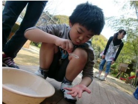
僕のでのひらにもふう～