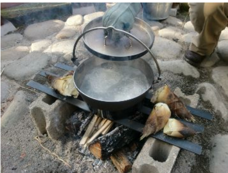
白玉団子をゆでています！