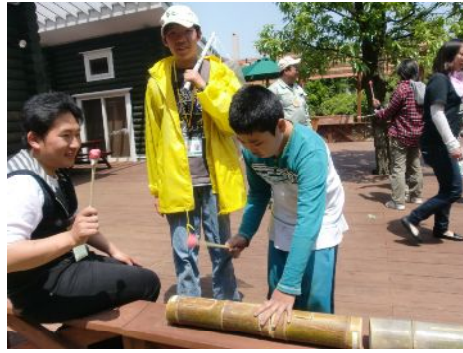
僕もやってみようかな～