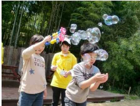
ほんときれいだねー☆