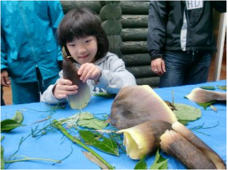
タケノコも掘れました！