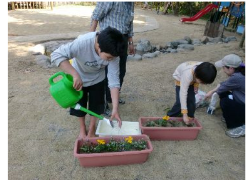
ちゃんと言ちますように・・・