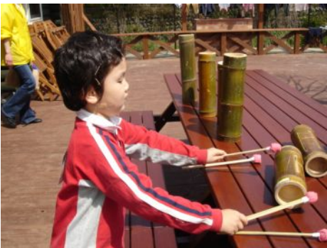
両手にばちを持って！