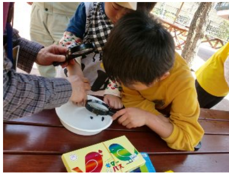
なんか動いてるぞ・・・