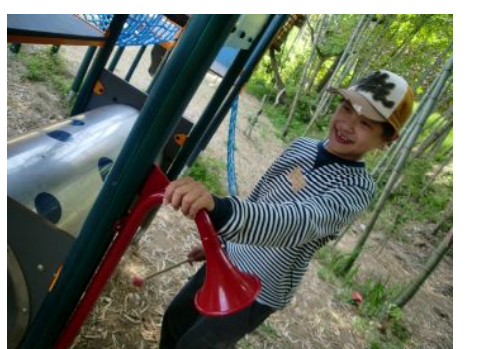
遊具もいろんな音がする！