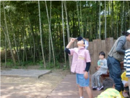
空に向かってふう～