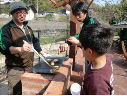
僕の代わりに取って～