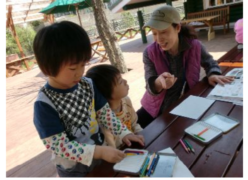
じゃあ色塗りしようか！