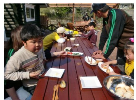
はやく食べたいな～