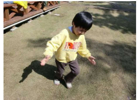
しゃぼん玉を追いかけろー！