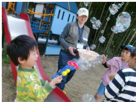
すべり台の前でも・・・！